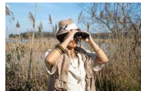
Riserva naturale Oasi della Contessa

Per gli amanti dell'outdoor è sicuramente consigliabile l'esperienza nell'Oasi della Contessa, una Riserva Naturale Regionale che rimane come ultima testimonianza di una palude costiera in questa zona. L'area è attrezzata per il birdwatching e permette di attendere il riposo di numerose specie che fanno di questo luogo un punto di sosta durante la migrazione. Da soli o in gruppo, accompagnati dalle guide ambientali che promuovono anche attività per i più piccoli, è possibile osservare gli aironi, le ghiandaie marine e scoprire la caratteristica vegetazione di questo straordinario habitat naturale.