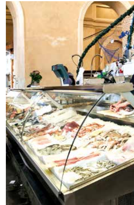
Salone del Pesce

La sua magnificenza e lo stile floreale delle capriate metalliche fanno da cornice al vociare simpatico dei commercianti, pronti a garantire l'esclusività dei propri prodotti. Le primizie del mare si comprano tra i banchi in marmo nel Salone del Pesce, dove a buon prezzo si trova il pescato del giorno, materia prima per la preparazione dei piatti labronici. Visitare il mercato di Livorno è un'esperienza sensoriale: colori, profumi e suoni si mescolano, restituendo un'emozione unica e originale che stimola il palato a gustare le roschette salate della tradizione ebraica, le uova bianchissime della "gallina livornese", assaggi di cacciucco e il tipico ponce alla livornese.