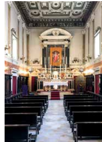
Chiesa di Santa Giulia

Livorno è una delle 25 tappe di questo itinerario evocativo che dalla Toscana arriva in Lombardia attraverso l'Emilia, collegando luoghi storici e religiosi dedicati alla devozione di Santa Giulia. Dal mare alle montagne fino alla pianura, il viaggio è un'esperienza di grande valore spirituale, storico e naturalistico ambientale.