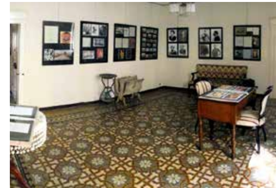
Casa Natale Amedeo Modigliani

Per chi visita Livorno, la casa dove è nato e vissuto questo artista di fama mondiale, è una tappa obbligata. L'appartamento si trova nel centro città, al primo piano della palazzina di Via Roma al civico 38. Qui il 12 luglio 1884 nacque Amedeo Modigliani, Dedo per i Livornesi, che visse con la sua numerosa famiglia e sempre sotto il sole di Livorno iniziò la sua formazione artistica. L'appartamento, che ha mantenuto la sua struttura originale, ospita un percorso espositivo di fotografie, documenti e riproduzioni di opere pittoriche che rievocano la vita, la personalità e l'arte del grande Dedo.