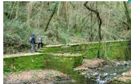
Percorso lungo l'Acquedotto di Colognole

Il toponimo si trova per la prima volta nel 1272 come "Collis Salvecti" (colle di Salvetto) in un contratto di vendita di terreni, rogato da tale "notaro Salvetto, figlio di Borgo, in Villa di Colle". Con la vittoria di Firenze, Colle divenne villa medicea, residenza di caccia e centro propulsore della Fattoria Granducale - medicea prima, lorenese poi - che nel momento della massima espansione comprendeva oltre venti poderi.