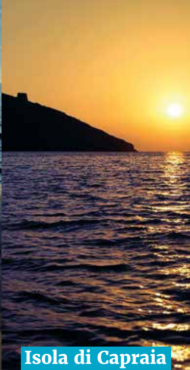
Isola di Capraia