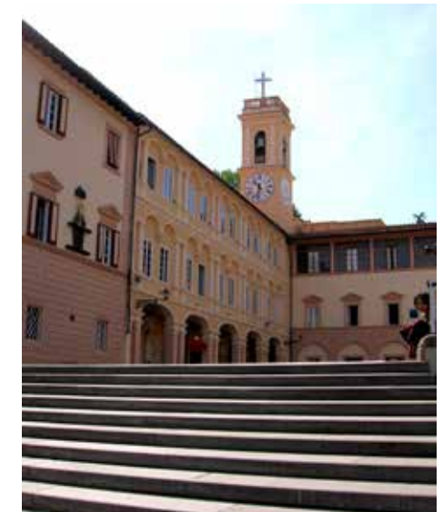
Santuario di Montenero

Luogo "oscuro", fitto di boschi e alberi secolari, anticamente era considerato poco sicuro, forse dimora di briganti e banditi. Da qui sembra derivare il toponimo Montenero.