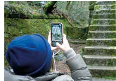
Percorso lungo l'Acquedotto di Colognole