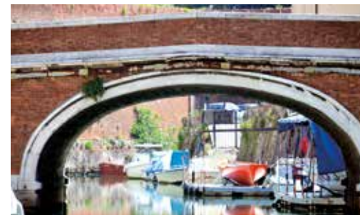
Ponte dei Domenicani, Quartiere della Venezia

"Se fossi un livornese, di quelli veri che dicono dé e parlano a mano aperta, muovendo le dita, come per far vedere che nelle loro parole non c'è imbroglio vorrei star di casa in qualche Scalo della Venezia".