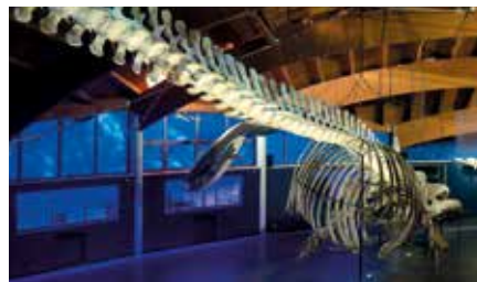
Museo di Storia Naturale del Mediterraneo

villa e parco per meglio approfittare del ricco porto franco di Livorno. Una saletta moresca al pian terreno, la sala da fumo, ricorda le fiabesche architetture dell'Alhambra di Granada. Notevole la scala decorata con putti in ceramica invetriata e un grande salone con giochi di specchi rievoca gli sfarzi preziosi di un tempo lontanissimo. Poco distante dal Museo Fattori merita una visita il Museo di Storia Naturale del Mediterraneo che ha sede nella storica Villa Henderson. In un percorso suggestivo e accessibile a tutti, è possibile ripercorrere l'evoluzione della specie umana attraverso l'incontro con l'uomo di Neanderthal, le pitture rupestri delle grotte di Lascaux, riprodotte in copia, e l'imponente scheletro della balena Annie, assoluta protagonista della Sala della Balena.