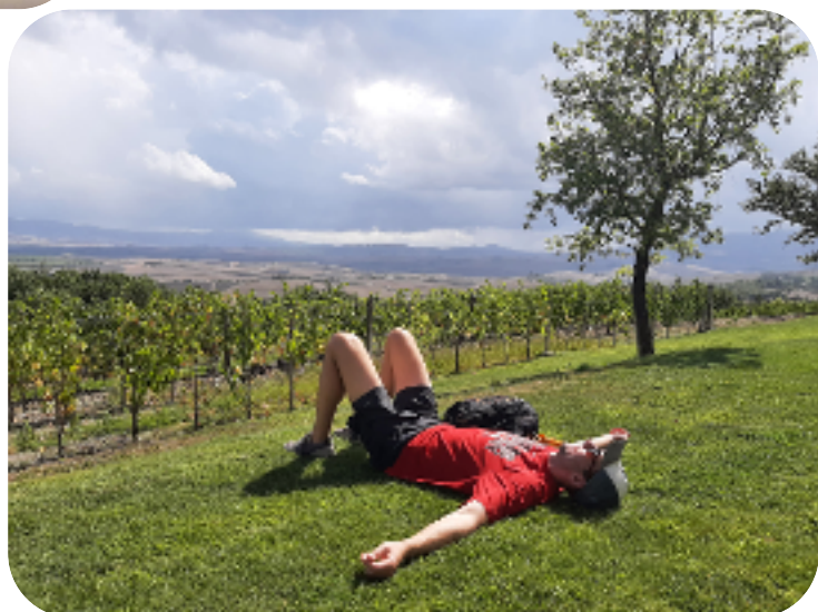
RELAX LUNGO LA VIA