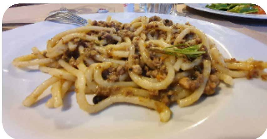
GLI IMMANCABILI PICI

Acquisteremo i nostri picnic nelle botteghe dei piccoli borghi per pranzare al sacco. Quando possibile pranzeremo in bar o locali tipici .